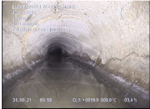
Colector circular fisurado y hundido