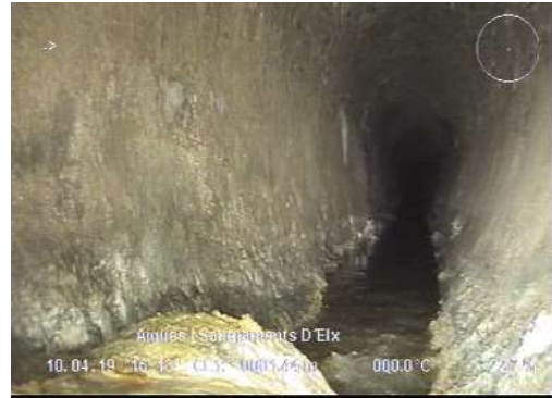
Ovoide. Vista general. Solera desaparecida